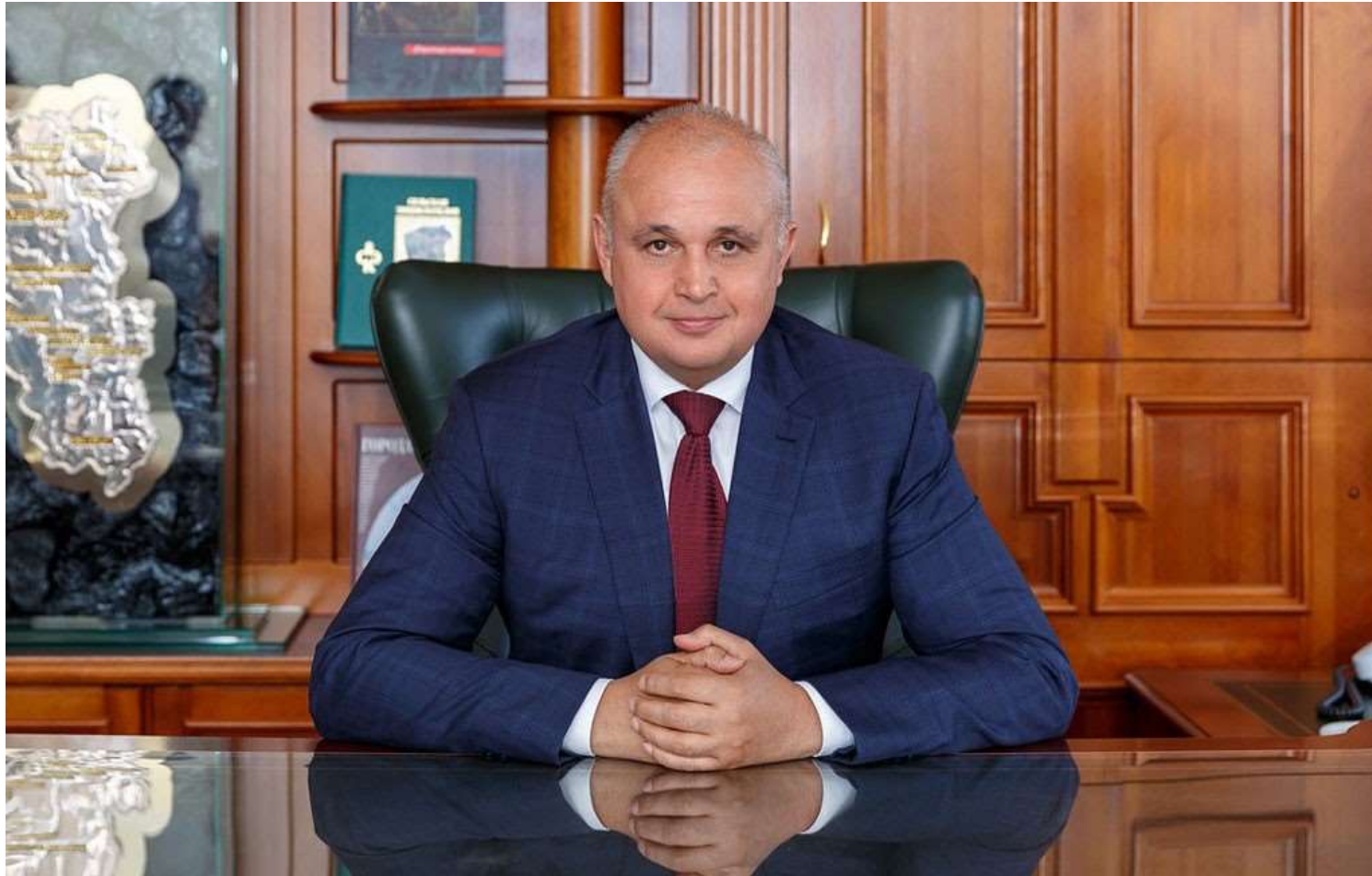
Сергей Евгеньевич Цивилев