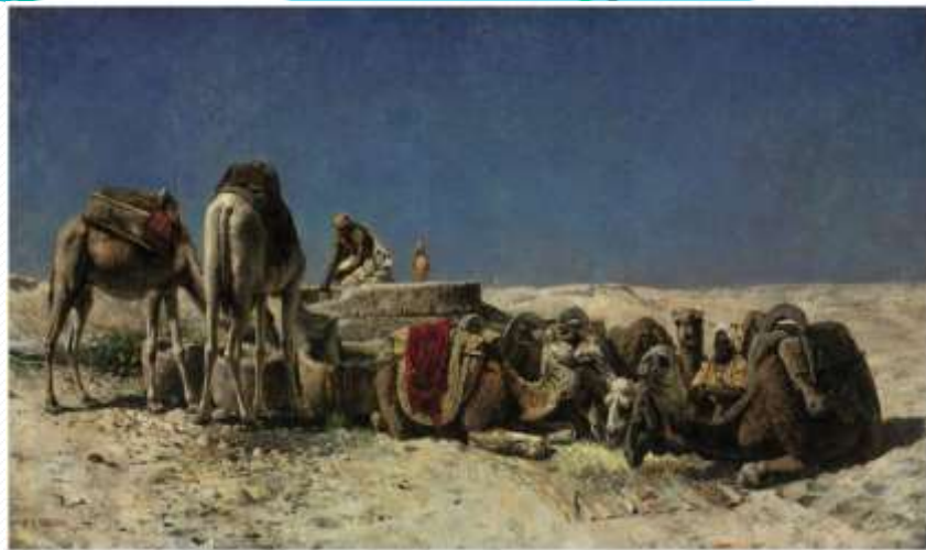
Решили они устроить привал