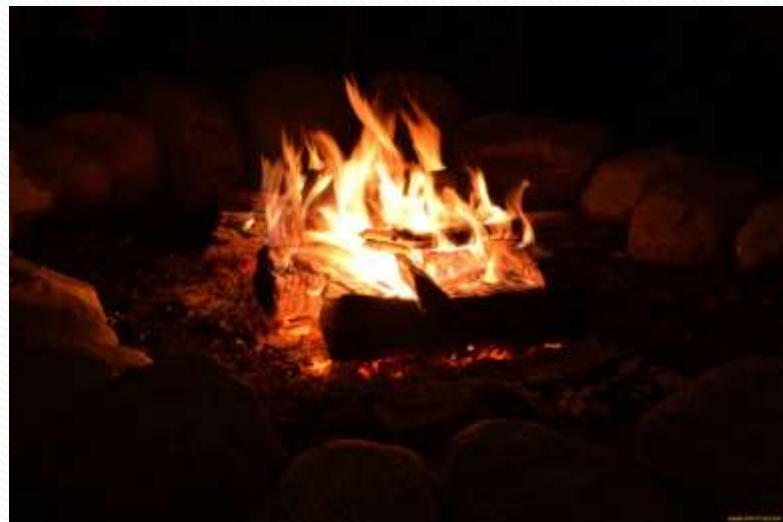
А чтобы ветер не задул пламя, они обложили костёр кусками соды, которую везли на продажу