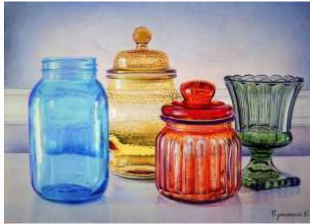
Может иметь форму