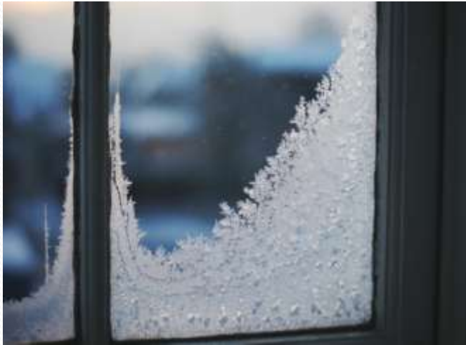
Не пропускает тепло и холод