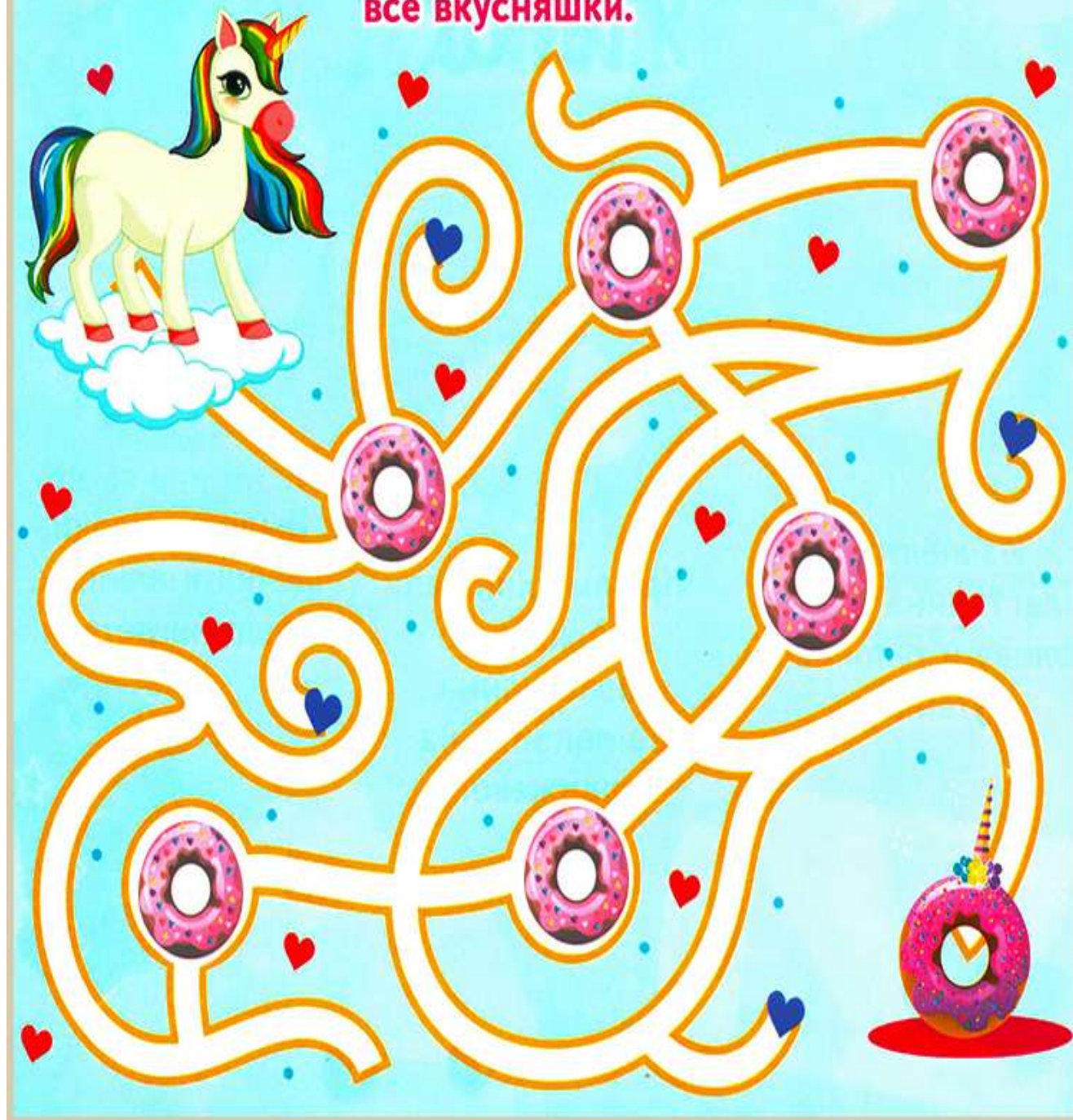
Лабиринт "День Рождение единорога"

У единорога день Рождение! А теперь помоги единорогу пройти лабиринт так, чтобы собрать все вкусняшки.