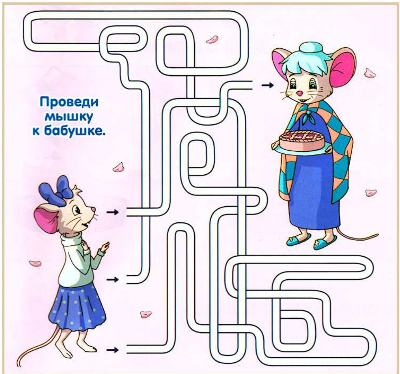
Лабиринт "Мышка идёт к бабушке в гости"