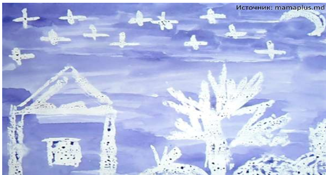
Рисование свечой и акварелью. Волшебные рисунки