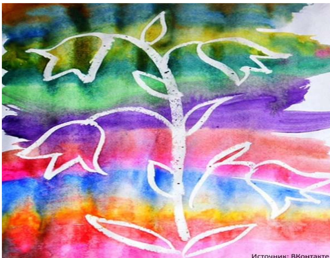
Рисование свечой и акварелью. Волшебные рисунки

Все дети очень любят рисовать и создать собственные шедевры. Сегодня расскажем вам про волшебное, необычное, нетрадиционное рисование воском и акварелью на бумаге и уверяем вас, что ваш ребенок будет безгранично рад тому, что у него все получится и ему наверняка захочется похвастаться своим рисунком. Сегодня мы знакомим вас с необычной техникой – рисование с помощью свечи . Такая техника выполнения рисунка обычно приводит детей в восторг, завораживая конечным эффектом появления изображения на листе бумаги. Рисование в такой технике дает ребенку уверенность в работе с краской, развивает воображение, мелкую моторику, что очень важно для детей дошкольного и младшего