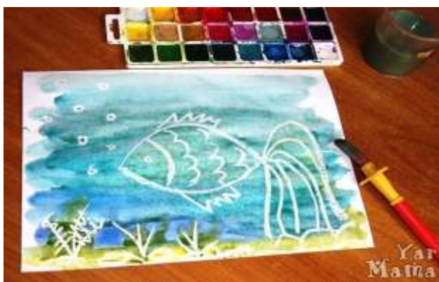
Рисование с помощью свечи

Далее будем рисовать акварельными красками. Лучше использовать более темные цвета акварели: синий, черный, фиолетовый, так эффект будет более заметен. Краски берем больше, а вот воды – меньше. Берем широкую кисть, обмакиваем ее в акварельную краску или гуашь и покрываем лист бумаги крупными мазками. Краска сползет с созданного контура, так как парафин, из которого сделана свеча, жирный. Рисунок появится как по волшебству!