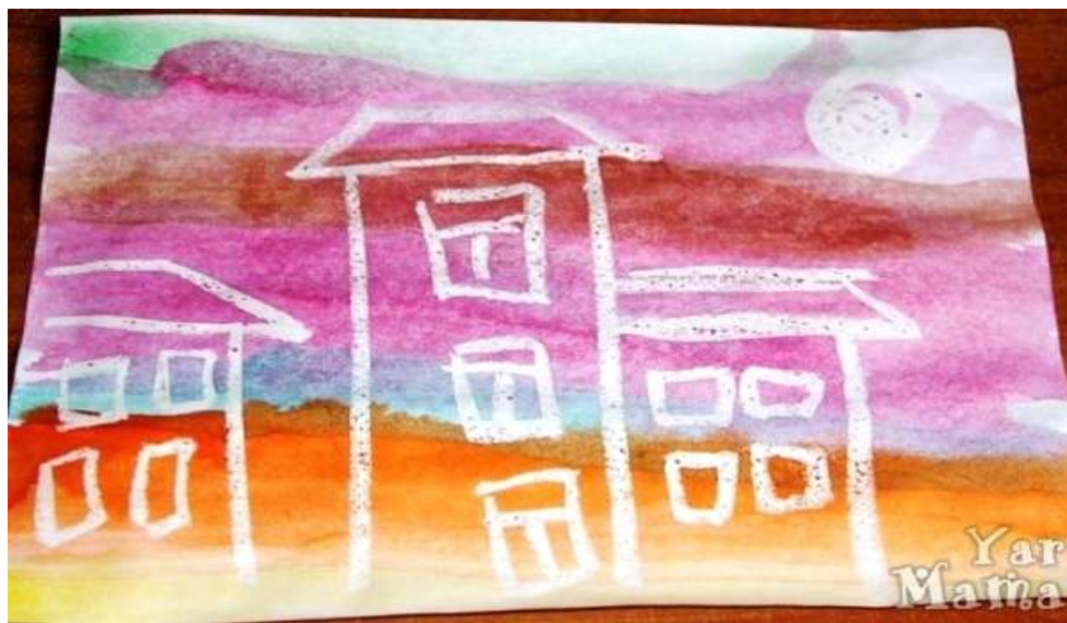
Рисование свечой и акварелью. Волшебные рисунки