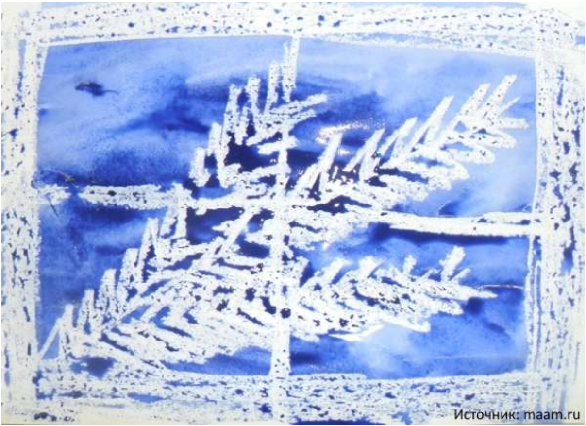
Рисование свечей и акварелью. Волшебные рисунки