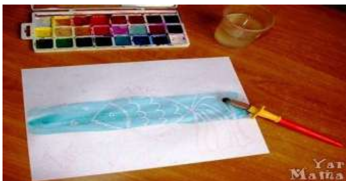
Рисование с помощью свечи

Эта рыбка нарисована восковым цветным карандашом.