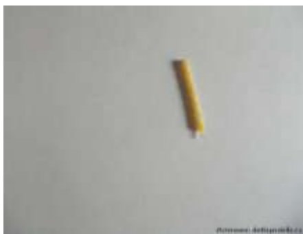
Рисование с помощью свечи

школьного возраста. Это даже в некотором роде игра, которая не утомляет малышей, а наоборот дает им положительные эмоции.