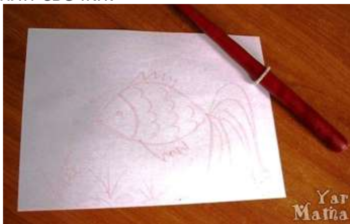
Волшебное рисование свечой

Чтобы было легче создать эскиз, перед тем как перейти ко второму шагу работы – рисование акварелью, можно предложить вашему малышу сначала нарисовать рисунок простым карандашом, а уже затем обвести его по контуру свечкой. А можно еще больше упростить задачу – взять обычную раскраску и обвести ее по контуру кусочком воска или свечи.