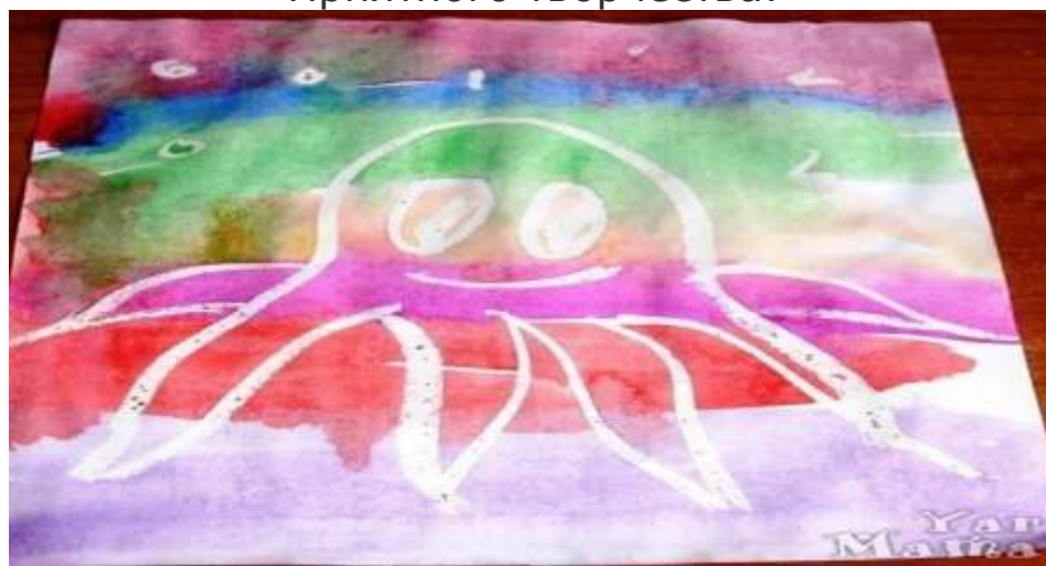
Рисование свечой и акварелью. Волшебные рисунки